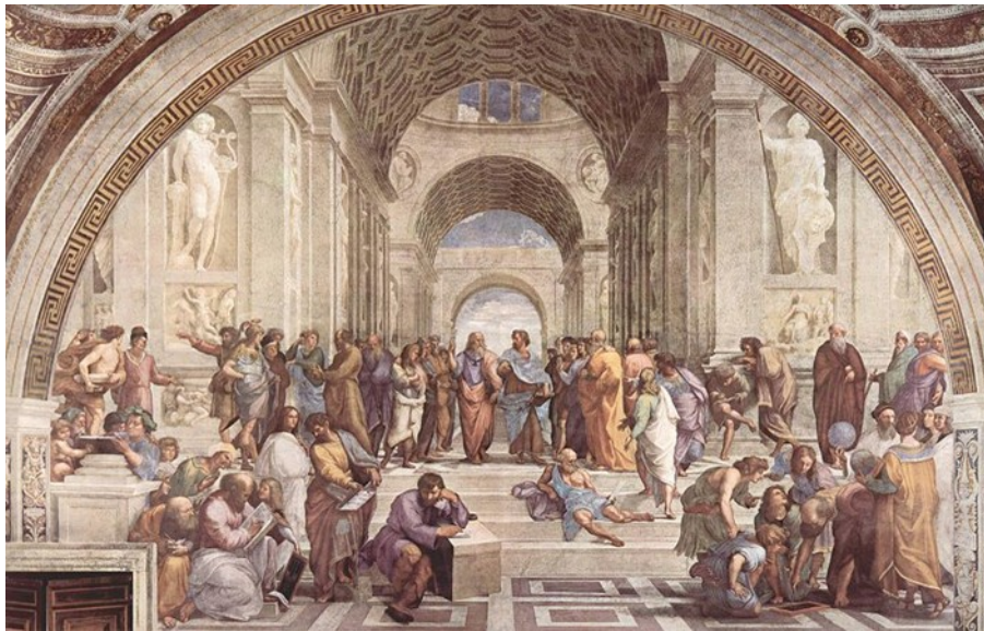
Slika 2: Platonova Akademija je bila nekakšen internat, kjer se je Platon družil z svojimi učenci.

Je bila izobraževalna ustanova, ki jo je leta 387 pr. n. št. ustanovil Platon. Uradno je bila priznana kot verska sekta, ki je častila boga Apolona in muze, dejansko pa je bila prva filozofska šola, ki je imela organiziran urnik oz. spored predavanj. Tako so se v sklopu gimnazije učili znanosti (matematika, astronomija, glasba) in vadili telovadbo in šport, medtem ko jim je filozofske nauke posredoval Platon med sprehodi po sadovnjaku. Platon na Akademiji na začetku njene dejavnosti ni poučeval samo filozofije, marveč tudi matematiko in naravoslovje. Akademija je bila uradno ukinjena leta 529 našega štetja.