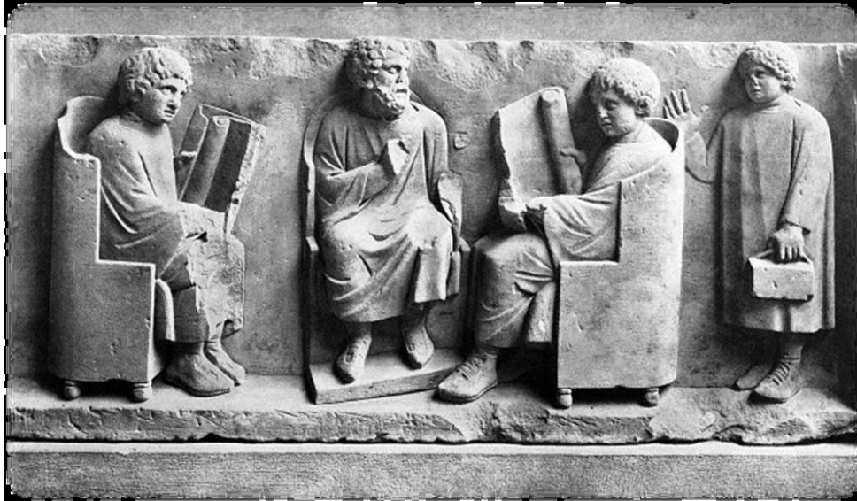
Slika 3: Šolski prizor pouka pri zasebnem učitelju.