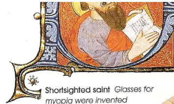
Shortsighted saint Glasses for myopia were invented around 1280. This 14th-century miniature is the earliest-known picture of spectacles.