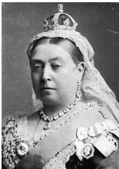
Slika 1 Viktorija I

Viktorija ali njeno pravo ime Alexandrina Victoria, je bila kraljica združenega kraljestva Velike Britanije in Irske ter cesarica Indije. Rodila se je 24. maja 1819, po dvainosemdesetih letih življenja je umrla 22. januarja 1901.