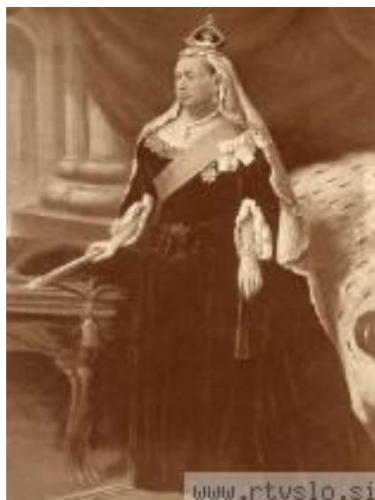
Slika 5 Viktorija I