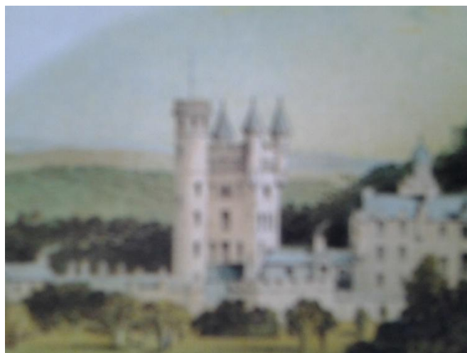
Slika 8 Balmoral

Viktorija in Albert sta si v Balmoralu v Škotskem višavju ustanovila zelo priljubljen družinski dom, ki ga kraljevska družina uporablja še danes. Leta 1861 ko je Albert umrl zaradi tifusa in Viktorija je bila strta od žalosti. Globoko je žalovala, opustila je javne dolžnosti in večinoma časa preživela v Balmoralu v družbi služabnika Johna Browna. Njeno odsotnost iz javnega življenja je jezilo britansko ljudstvo in nekaj let je bila zelo nepriljubljena.