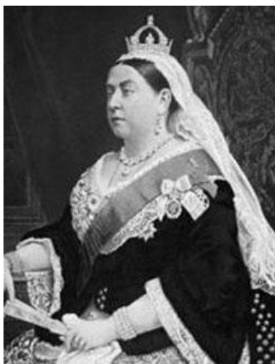
Slika 2 Viktorija I.

Viktorijo so ljudje spominjajo kot majhne, v črno zavite dame, ki žaluje za svojim soprogom Albertom. Viktorija je bila zelo dostojanstvena in njeni podložniki so jo nadvse spoštovali.