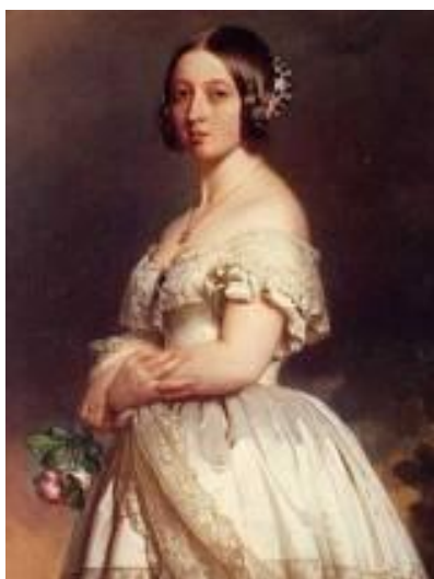
Slika 4 Viktorija I v mladosti

Obdobje Viktorijine vladavine je bilo zaznamovano z veliko širitvijo britanskega imperija. Njeno obdobje, imenovano tudi viktorijanska doba, je predstavljalo vrh industrijske revolucije, čas velikih socialnih, ekonomskih in tehnoloških sprememb.