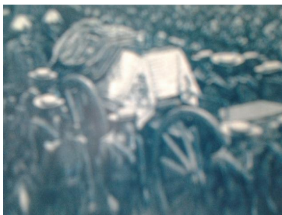
Slika 9 Sprevod na pogrebu Viktorije I.

Kraljica Viktorija je botrovala imenoma Viktorijini slapovi na reki Zambezi in Viktorijino jezero v vzhodnoafriškem Jezerskem višavju.