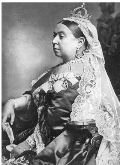
Slika 3 Viktorija I

Viktorija je bilo komaj 18 let, ko je postala kraljica Združenega kraljestva Velike Britanije in Irske od 20. junija 1837. Cesarica Indije pa je bila od 1. januarja 1877 do smrti. Njena vladavina je trajala več kot 63 let, kar je dlje, kot je vladal katerikoli angleški kralj. Viktorija je bila zadnja vladarka iz hiše Hanoverancev, njen naslednik, Edvard VII., je pripadal hiši Saxe-Coburg-Gotha.