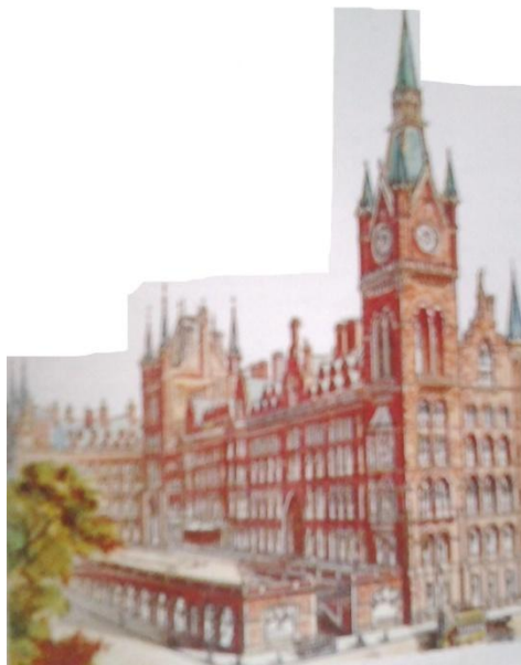
Slika 6 železniška postaja sv. Pankracija

Viktorijci so ljubili umetelno okrasje. Skoraj vsi Viktorijski predmeti, od uličnih svetilk do čajnih žličk, so bili okrašeni z rabarijami, vzorci in drugimi okraski. Velike hiše in javne zgradbe na primer železniška postaja sv. Pankracija v Londonu so bili videti kot gradovi, katedrale in palače.