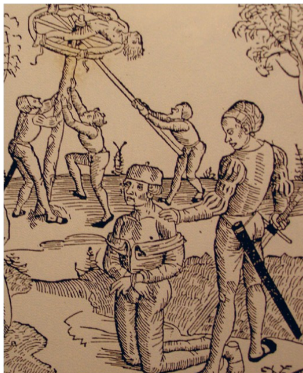
Slika 8: Usmrtitev obsojenih upornikov