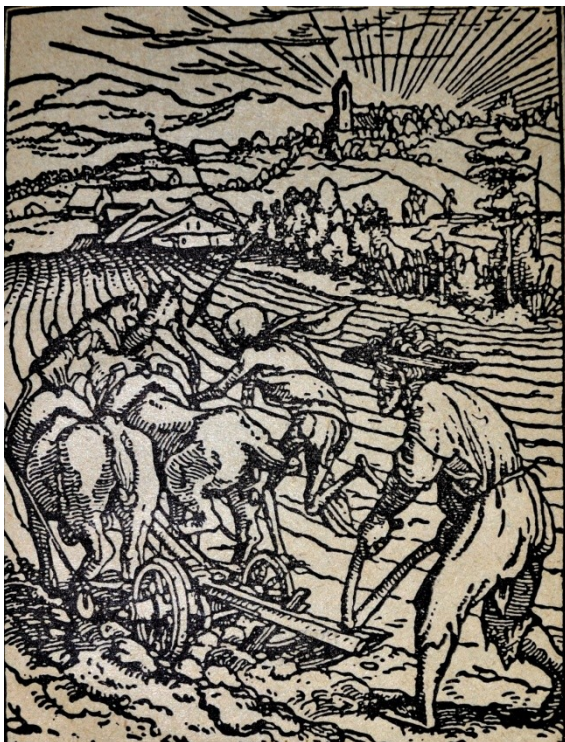
Slika 9: Delo upornikov

Kmetje so morali plačati vso škodo, uveden je bil puntarski davek