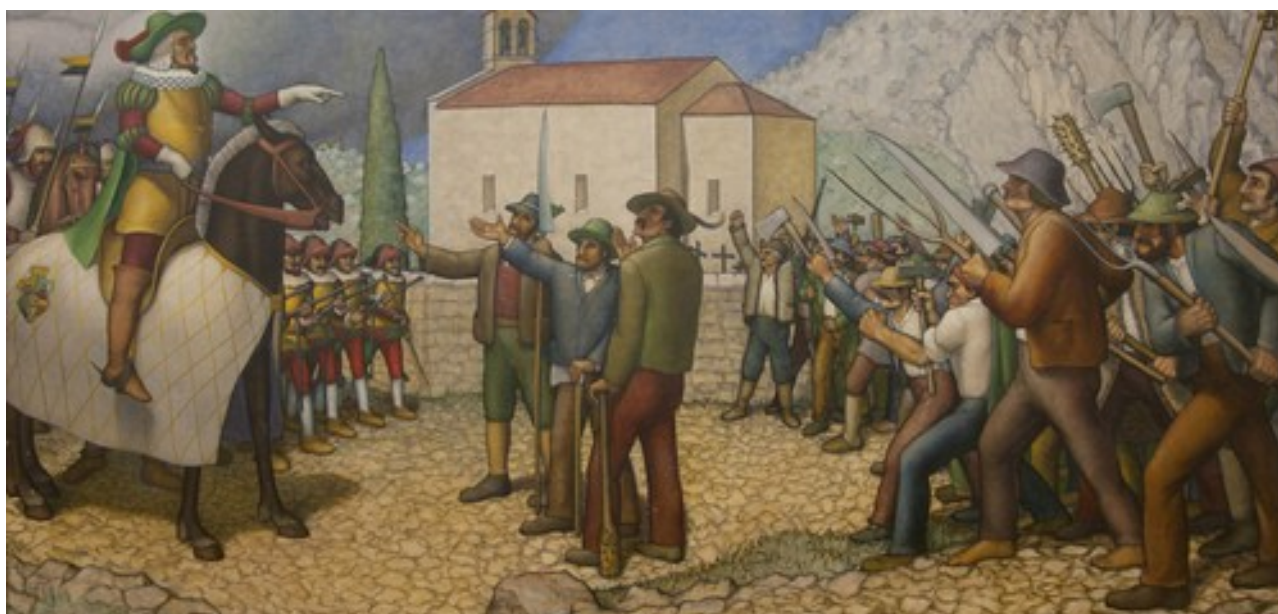
Slika 2: Fevdalec proti upornim kmetom

KLJUČNE BESEDE: kmetje, upori, fevdalci, puntarski davki, kmečka zveza