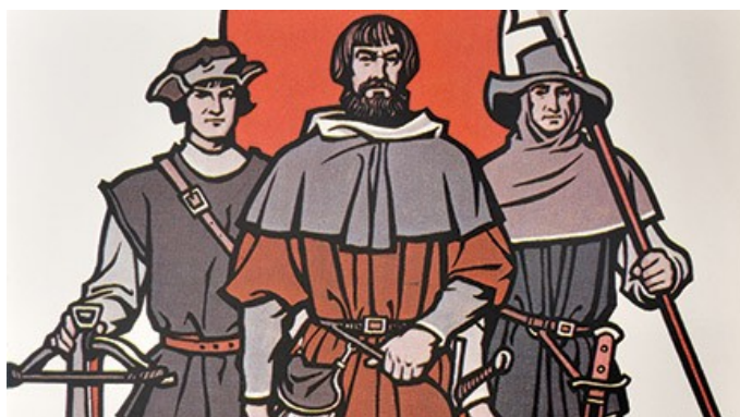
Slika 3: Fevdalec in dajatve

Nastala je kmečka zveza ali punate , pisali so cesarju ampak neuspešno, zato so se kmetje sami organizirali in si postavili cilj in, sicer da si bodo sami izboljšali položaj in sicer z upori. Njihovo orožje je bilo kmečko orodje (vile, sekire, kose...).