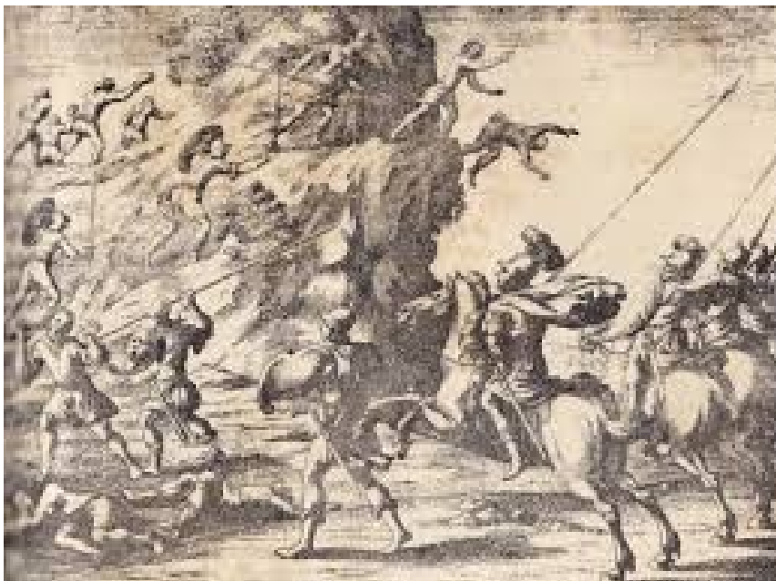
Slika 6: Kmetje v boju proti fevdalcem