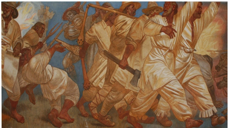
Slika 6: Kmetje med uporom