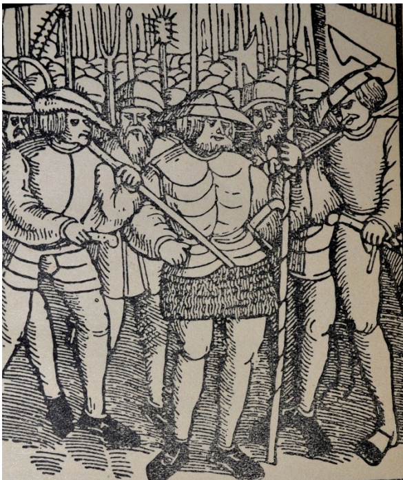
Slika 4: Upor kmetov