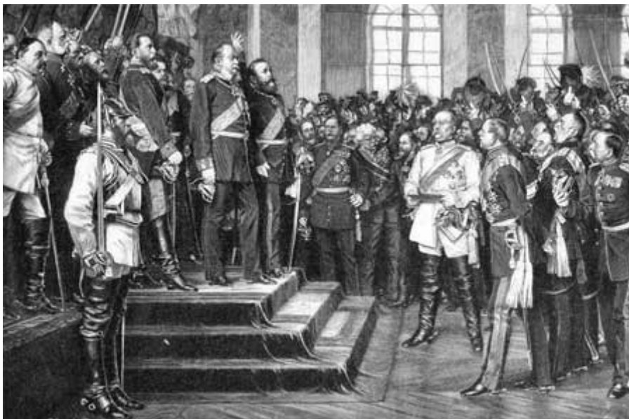
Slika 7: Prisega kmetov odpovedi nadaljnjim uporom