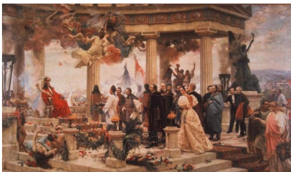
Slika 5: Obsodba Matije Gubca