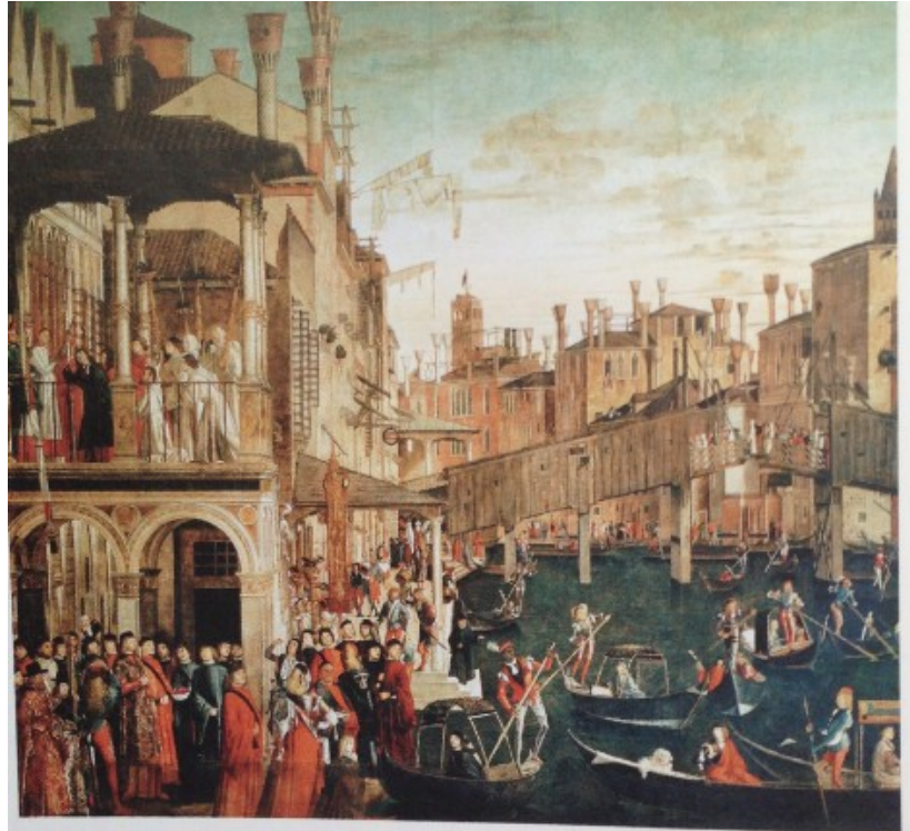
Rialto – gospodarsko središče mesta

Doževa palača – središče politične moči Palača beneških dožev, ki jo na strani proti obali krasi impozantna gotska fasada, je bila s svojo slovesno arhitekturno zasnovo in z bogatim okrasjem simbol beneške moči. Za velikimi okni se nahaja eden največjih prostorov v srednjeveški Evropi: ogromna dvorana velikega sveta, kjer se je lahko zbralo več kot 1000 ljudi, članov tega organa. Palača se je razvila iz zgodnjersrednjeveške trdnjave, v kateri je od nekdanj stoloval beneški dož. Z rastjo politične moči organov republike se je dožev vpliv zmanjšal. Izguba politične vloge je vidna tudi v sami palači, četudi je ta poimenovana po njem: doževo zasebno stanovanje je v njej potisnjeno na rob, v njenem središču so razkošni prostori najvišjih uradov, velikega sveta, senata in sveta deseterice.