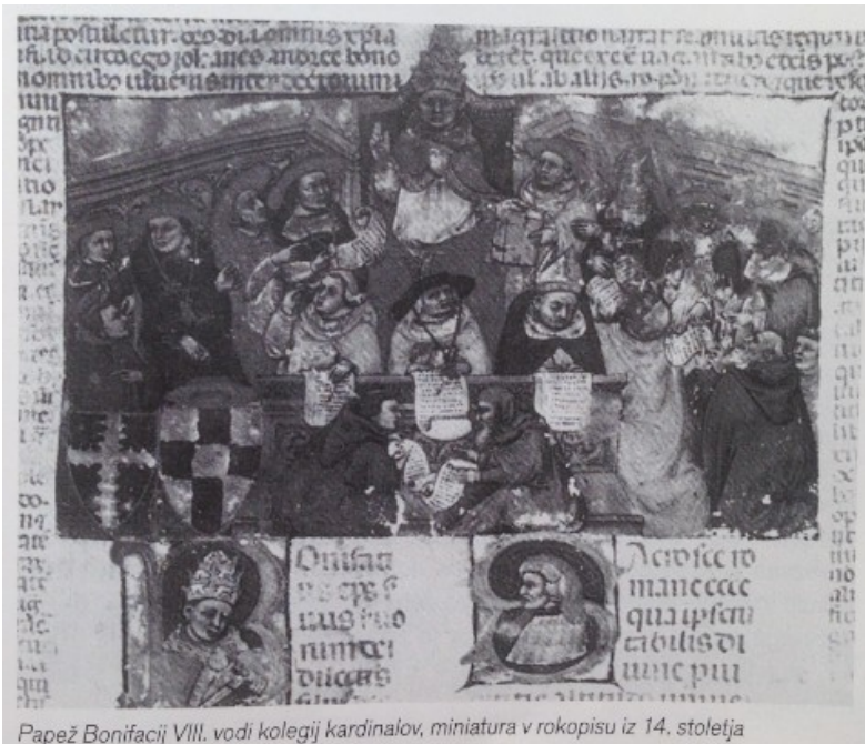
Papež Bonifacij VIII. vodi kolegij kardinalov, miniatura v rokopisu iz 14. stoletja