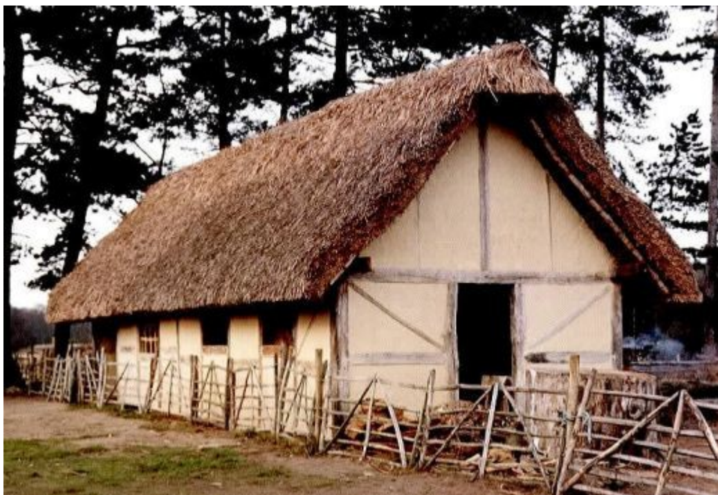
Primer tipicne hiše