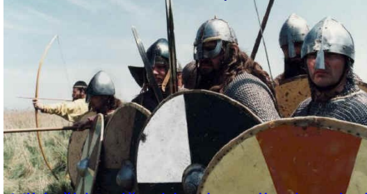
Vikinški vojščaki pripravljeni na boj

Vikingi so bili dobri in neustrašni vojščaki. Imeli veliko orožja in posamezni kosi orožja so bile že prave umetnine. Nasprotniki so se mocno bali hrabrih vikinških vojščakov, saj so bili znani po svoji že skoraj nadnaravni moci, preziranju smrti, pogumu in tudi gibčnosti, saj nikoli niso nosili več kot eno večje orožje hkrati. Pravtako pa so bili znani po svoji discipliniranosti. Kot orožje so uporabljali mece, ki so bili najbolj cenjeno orožje, sekire, ki so najbolj znane. Za boj na daljavo so uporabljali sulice in loke. Zaščitili pa so se z celadami in ščiti.